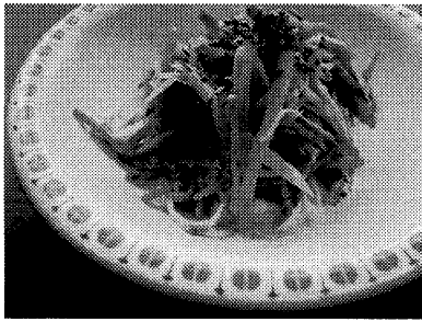
写真5. 斜め上方から撮影された写真