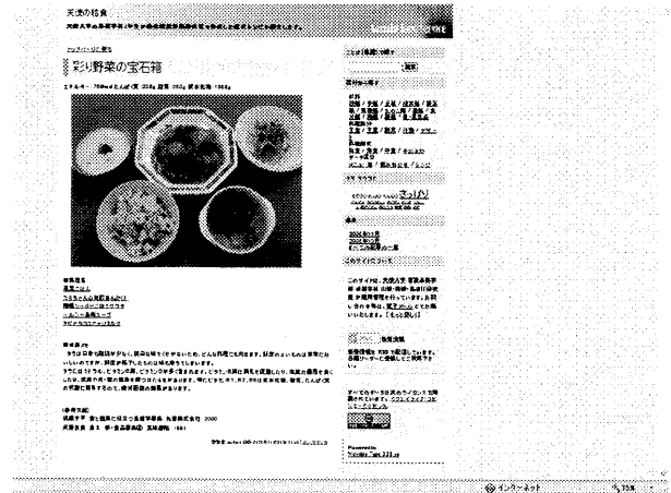
写真3. 献立と栄養メモ