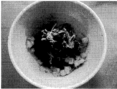
写真6. 真上から撮影された写真

「栄養メモ」の作成においては、インターネットからの引用が多く見られた。インターネットからの引用は間違いも多く、公的な機関のもの以外は使用を禁止しているにもかかわらず、インターネットから多用されていた。また、書籍に記載されている情報についても自分で確認することなく、そのまま情報を引用する傾向があった。