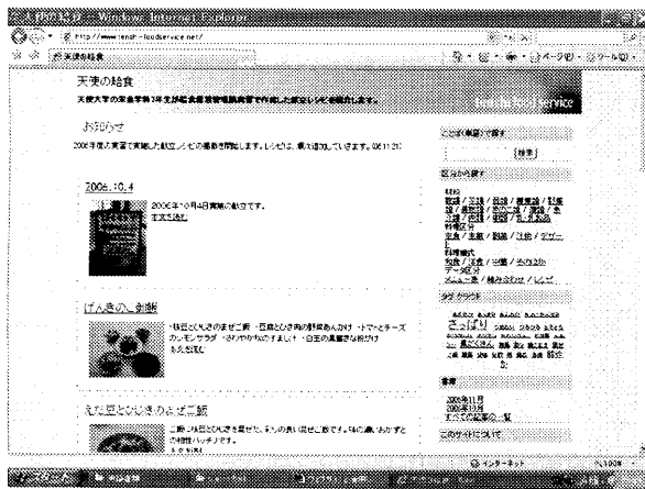
写真1. 「天使の給食」のトップページ